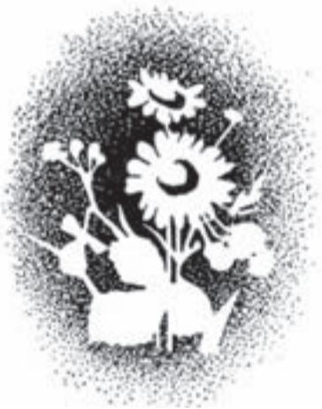
Подготовила Оля Попова