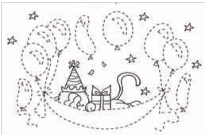
Обведи шарики и раскрась картинку