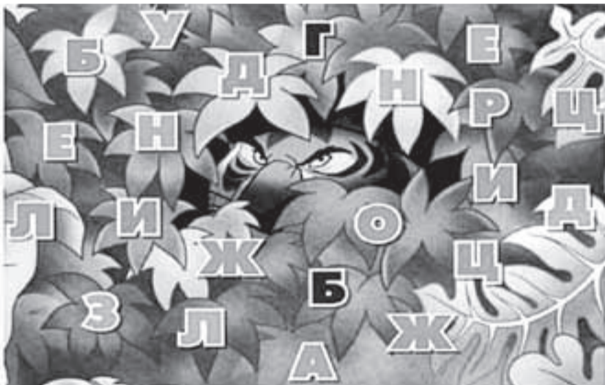
Шер-Хан прячется в джунглях, чтобы напасть на свою жертву! Найди слово, спрятанное в картинке. Для этого вычеркни все буквы, которые появляются дважды, а из оставшихся составь слово.