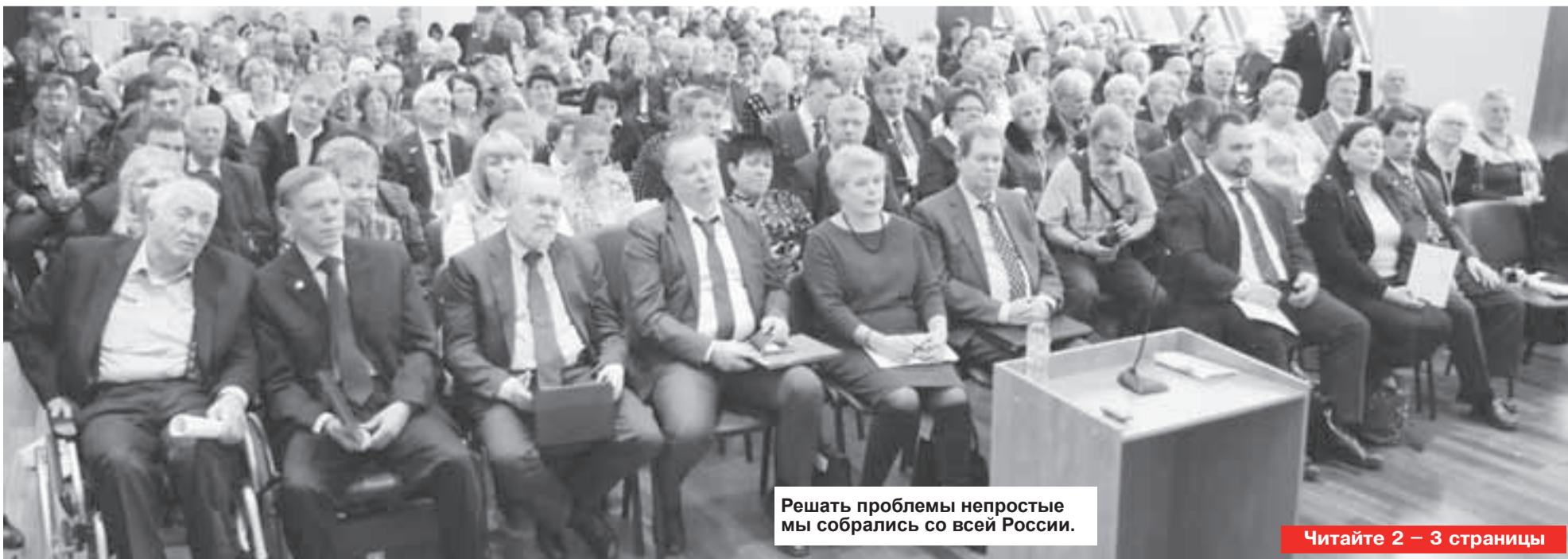
Решать проблемы непростые мы собрались со всей России.