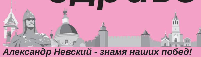
Александр Невский - знамя наших побед!