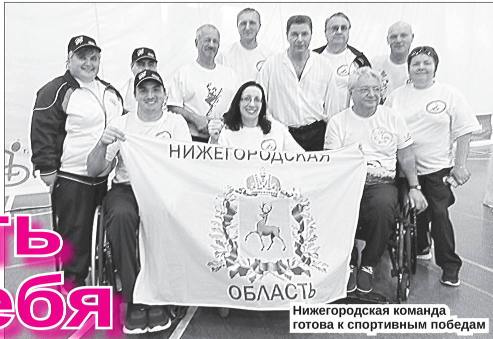
Нижегородская команда готова к спортивным победам