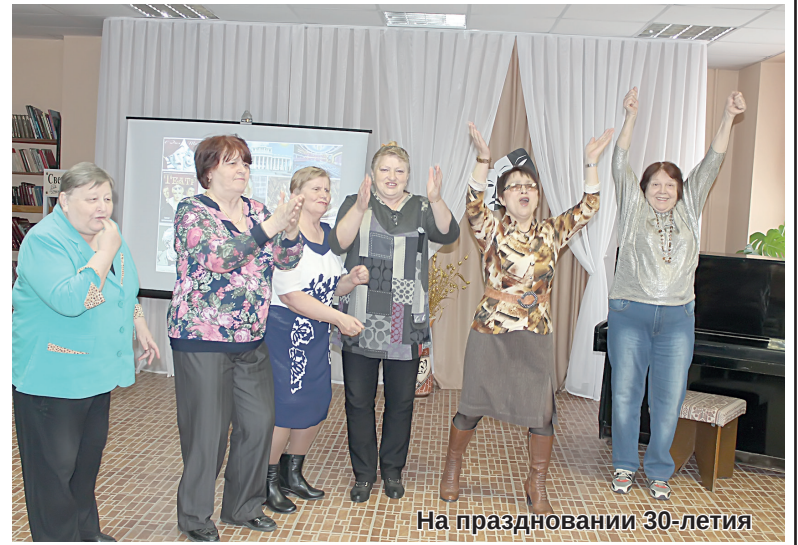
На праздновании 30-летия

Очень активно помогают председателю РО ВОИ чле-